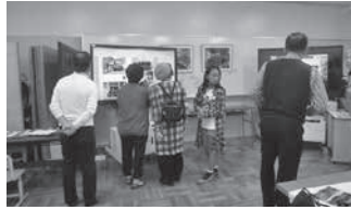
クリックするだけでアルバムが表示