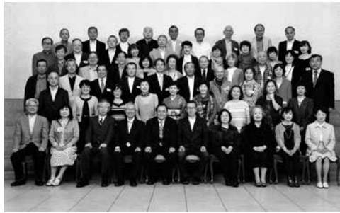
2017年4月16日 箕面第一中学校20期生同窓会 於 ホテル阪急インターナショナル