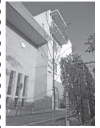
70周年記念植樹の桜 (西門)