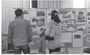
各期のパネル展示